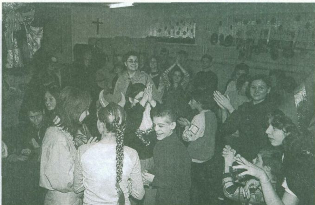
Harcerze wśród niepełnosprawnych