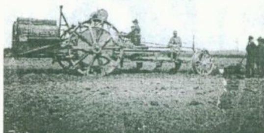
Maszyna Parowa na wystawie

straży pożarnej z rytwiańskiej cukrowni. Aby wejść na plac należało wykupić bilet za 10 kopiejek, którą to opłatę można było wtedy, uznać za symboliczną. W dniu rozpoczęcia wystawy, w czasie którego zwiedziło ją 4 tysiące ludzi, a w ciągu jej trwania blisko 25 tysięcy, ówczesny Staszów „...cicha dotąd i ustronna miejscina, przez którą niekiedy przejechał powóz lub samochód, przemienia się nagle w miasto pełne życia i ruchu wielkomięjskiego...”. Zwiedzającym czas umilały orkiestry straży ogniowej: staszowskiej, ćmielowskiej i sandomierskiej oraz orkiestra włościańska z Kielc. Imprezę zakończyło rozdanie nagród i wy-