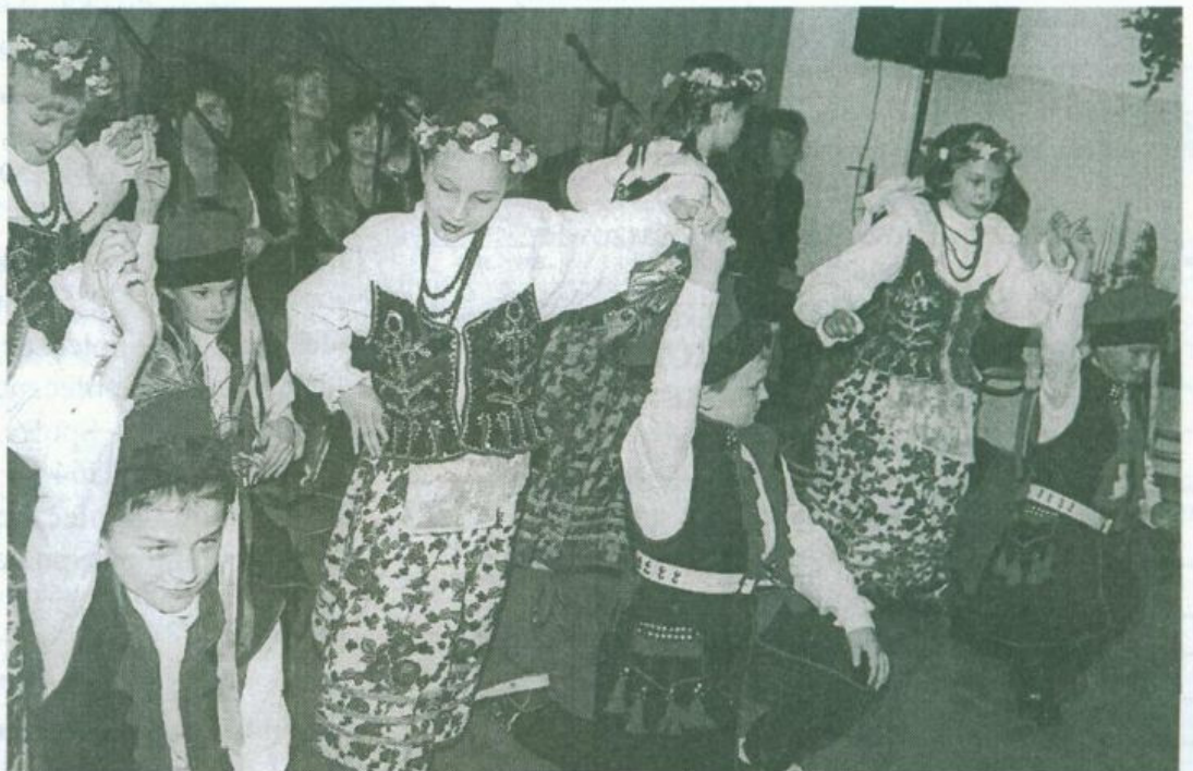
Uczniowie III klasy tańczą krakowiaka