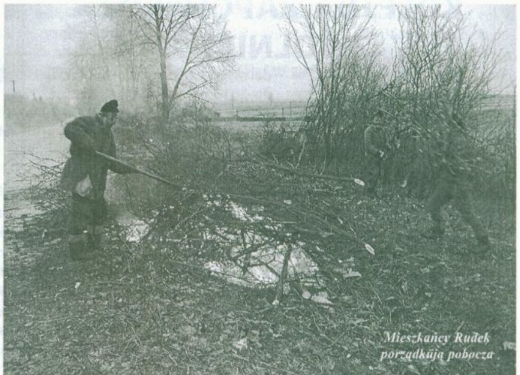
Mieszkańcy Rudek porządkują pobocza