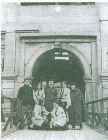
Uczestnicy Rajdu przed bramą zamku w Krzyżtoporze