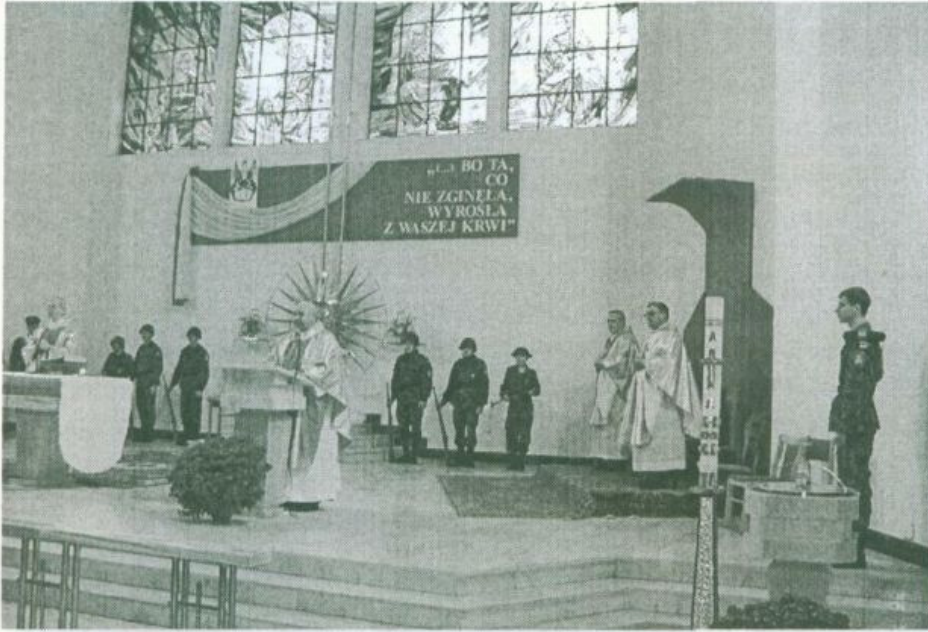
W czasie mszy w kościele p.w. Świętego Ducha

daleka. Biorąc jednak pod uwagę wszystko to, co nasi rodacy zdolali stworzyć w ciągu dwudziestolecia międzywojennego, powinniśmy być świadomi, że w dniu 11 Listopada, czcimy nie tylko męstwo i poświęcenie polskiego żołnierza, ale także rozum polityczny, cierpliwość oraz upór w dążeniu do celu, a także zdolności przewidywania i działania polskich polityków w najtrudniejszych sytuacjach. Czczymy umiejętności organizacyjne tych, którzy budowali zręby polskiej administracji, polskiego sądownictwa, systemu monetarnego, wychowania szkolnego - słowem polskiego państwa. Z tego, co osiągnęli, słusznie możemy być dumni". Następnie starosta odniósł się do wydarzeń z ostatnich dni mówiąc: „... w roku obecnym, 84 rocznica tego szczególnego wydarzenia w dziejach naszego narodu, przypada w czasie wyborów samorządowych, kiedy to po raz pierwszy w dziejach powojennej Polski, społeczeństwo decyduje w bezpośrednim głosowaniu nie tylko o wyborze swoich przedstawicieli w radzie gminy, powiatu czy sejmiku województwa, ale także o tym, kto będzie sprawował funkcję wójta, burmistrza i prezydenta miasta.