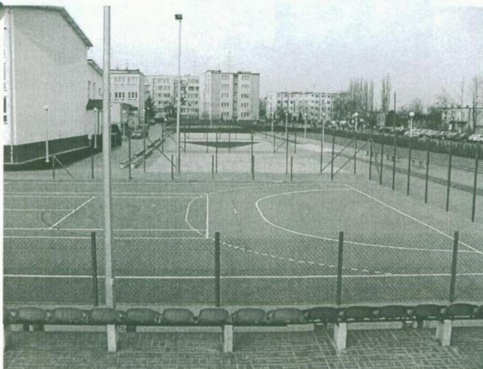
Kompleks boisk, tuż przed odbiorem technicznym