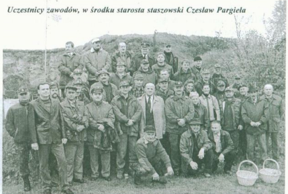
Uczestnicy zawodów, w środku starosta staszowski Czesław Pargieła