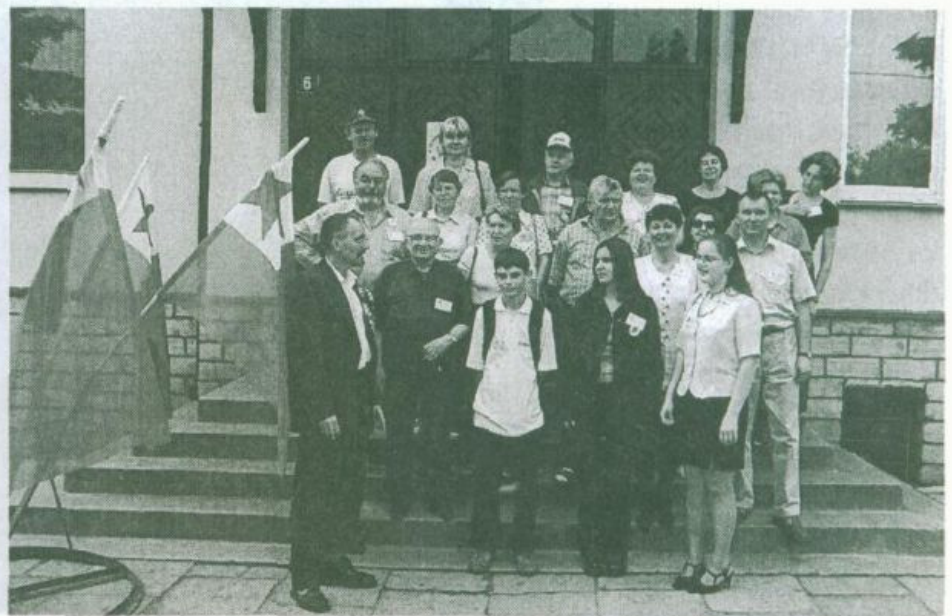
Uczestnicy zlotu w Staszowie, pierwszy z lewej autor artykułu