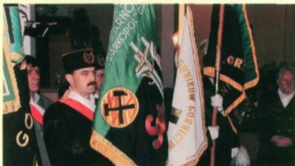
Poczty sztandarowe uświetniają każdą uroczystość