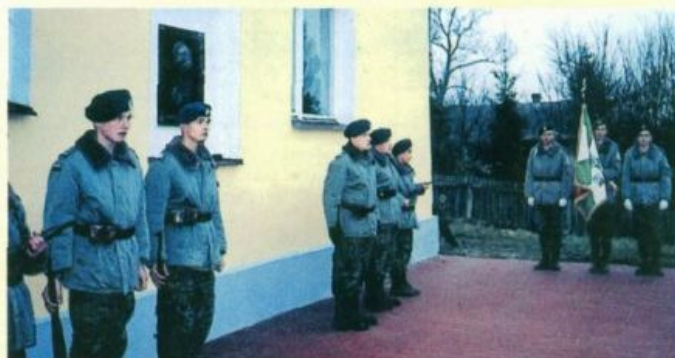
Poczet sztandarowy i warty honorowe dla upamiętnienia ofiar